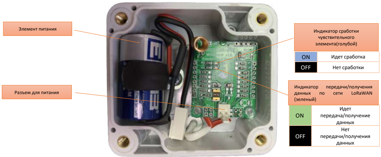
Рис.1 Описание устройства ROSSMA IIOT-AMS LEAK DETECTOR